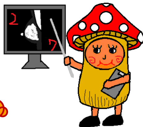
大和なでしこ マスコットキャラクター なでしこちゃん

お待たせしました！今年もやります！ 年に1度のワイワイ企画、症例祭り！！ 今年は MMG と US 読影の基礎を行います。 基礎を学んだ後は、5M モニタを使用した MMG 読影をします。 US を中心に各モダリティの解説もします。 試験や臨床にも役立つはず！！