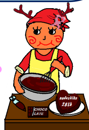
大和なでしこ マスコットキャラクター なでしこちゃん

今回は、生検の使い分けなど具体的なお話と、技師も携わる ステレオガイド下マンモトーム生検について基本的な内容を ご講演頂きます。生検はチョコッと採取するだけのようで、 奥が深い！！普段携わっている方もそうでない方も 一緒に勉強しましょう！